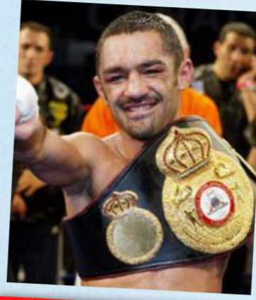
MAYAR MONSHIPOUR KERMANI

Triple champion du monde de boxe, champion d'Europe